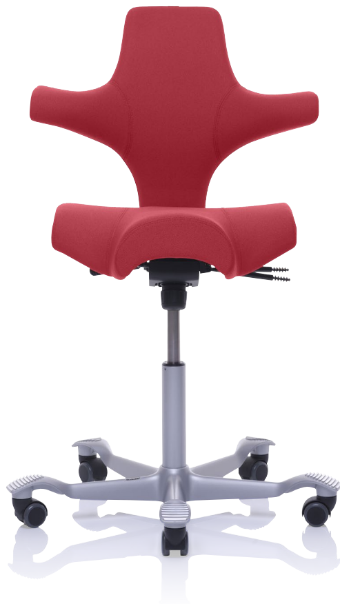
Design: Peter Opsvik. Patent- og designbeskyttet.